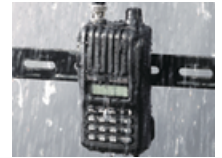
Kiểm tra kháng nước